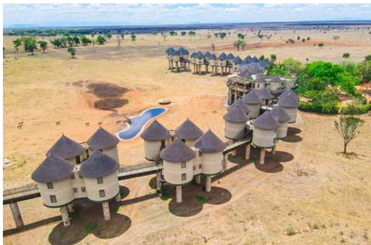
TAITA HILLS SANCTUARY

La réserve privée de Taita Hills (Taita Hills Wildlife Sanctuary) est un parc situé en bordure du parc national de Tsavo West. Sa chaîne de montagnes verdoyante et ses plaines herbeuses regorgent d'animaux sauvages. C'est certainement ce qui en fait un lieu incontournable lors d'un voyage au Kenya.