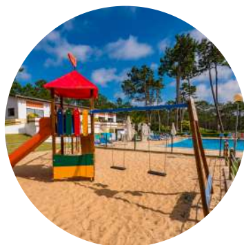
Aire de jeux pour enfants