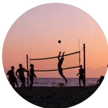
Animations en haute saison