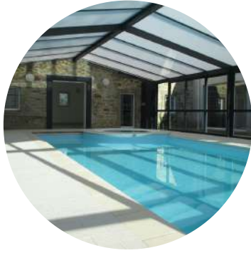
Piscine intérieure chauffée