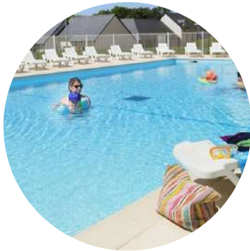
Piscine extérieure chauffée de mai à aout.