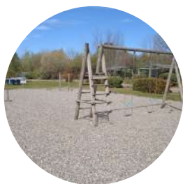
Aire de jeux enfants