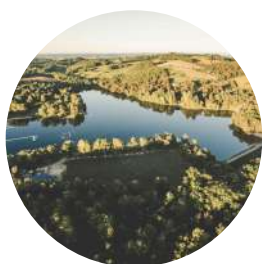
Plan d'eau de Miel (juillet/août payant de 10h à 17h, incluant la baignade surveillée et les pédalos)