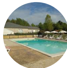
Piscine extérieure (ouverte de mai à fin août selon conditions météo)