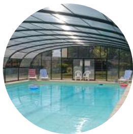
Piscine intérieure chauffée