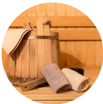
Espace sauna et hammam