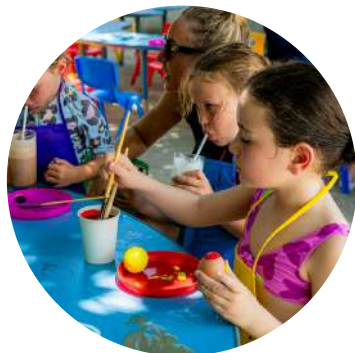
Club enfants en haute saison