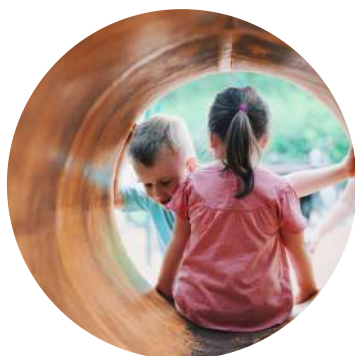
Aire de jeux pour les enfants