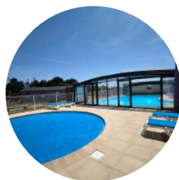
Piscine et pataugeoire